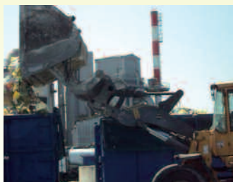
Chargement des bennes

3 Une fois sur le site, les camions vident les OM dans les fosses de l'incinérateur, où elles vont pouvoir être traitées.