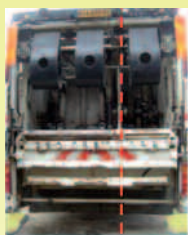
Vue arrière d'une benne Bi-compartmentée

1 Des camions-bennes passent collecter les bacs d'ordures ménagères (OM) et les sacs jaunes. Il existe deux types de camions : les Bom qui collectent soit les OM, soit les sacs jaunes ; et les Bi-compartmentés qui, comme leur nom l'indique, possèdent deux compartiments et peuvent collecter en même temps les OM et les sacs jaunes sans les mélanger.