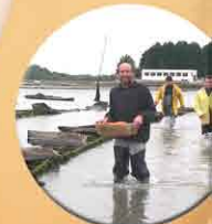
Installation des poches