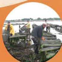
Remises en place de tables