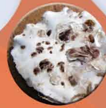
Naissain sur coquille d'huître

C'est un travail d'accompagnement de la nature qui permet aux huîtres de se développer dans les meilleures conditions possibles. Trois années environ se sont ainsi écoulées.