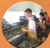
Tri au tapis