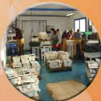
Mise en bourriche