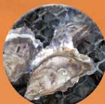
Huîtres en pousse