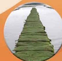
Rangée de tables