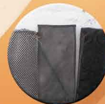
Poches de différents maillages