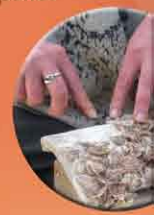
Décollage du naissain à la main